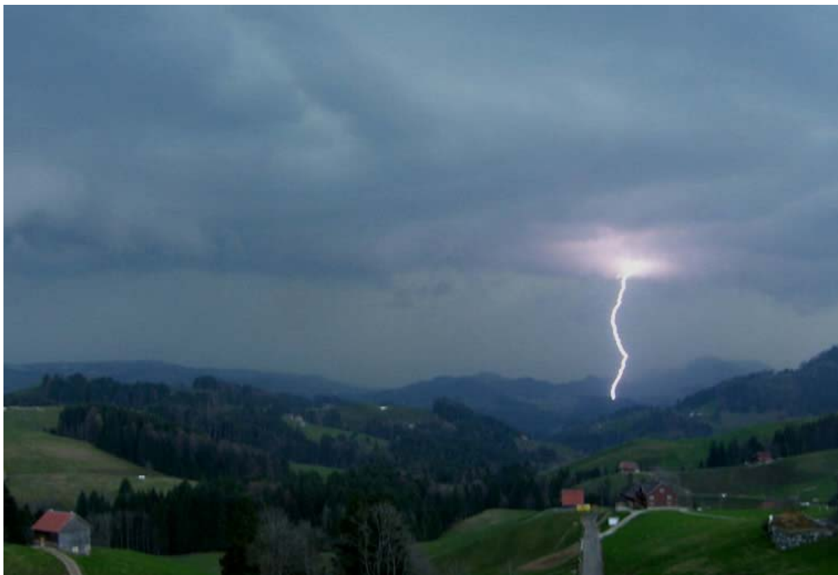
22.4.2006 Gewitteraktivität Wetterstation Schwellbrunn: Wie im Hochsommer...